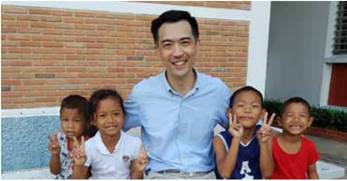
เรียน ท่านผู้มีจิตเมตตา

สถานการณ์การระบาดอย่างต่อเนื่องของโรคโควิด-19 ในขณะนี้ ได้ส่งผลกระทบต่อทุกชีวิตอย่างหลีกเลี่ยงไม่ได้ มูลนิธิเด็กโสสะฯ ขอร่วมส่งกำลังใจและภาวนาให้ทุกท่านมีสุขภาพที่แข็งแรงสามารถผ่านพ้นวิกฤติครั้งนี้ไปด้วยกันให้ได้