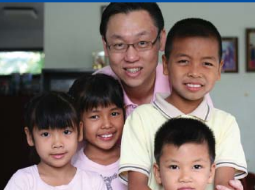
เรียน ท่านผู้มีจิตเมตตา

ตลอดระยะเวลา 44 ปี ที่มูลนิธิเด็กโสสะแห่งประเทศไทยฯ ในพระบรมราชูปถัมภ์ มุ่งมั่นตั้งใจให้ความช่วยเหลือเด็กไทยที่สูญเสียพ่อแม่ ไร้ญาติมิตร ให้ได้เติบโตขึ้นในครอบครัวทดแทนถาวร เด็กๆ จะมีครอบครัวที่อบอุ่น มีแม่โสสะที่ให้การดูแลด้วยความรัก มีพี่น้องในบ้าน อยู่ร่วมกันในชุมชน หมู่บ้านเด็กที่ช่วยเหลือเกื้อกูลกัน นั่นเพราะเราเชื่อมั่นว่า “ครอบครัว” คือ ปัจจัยพื้นฐานสำคัญในการหล่อหลอมเด็กคนหนึ่งให้เป็นคนที่สมบูรณ์