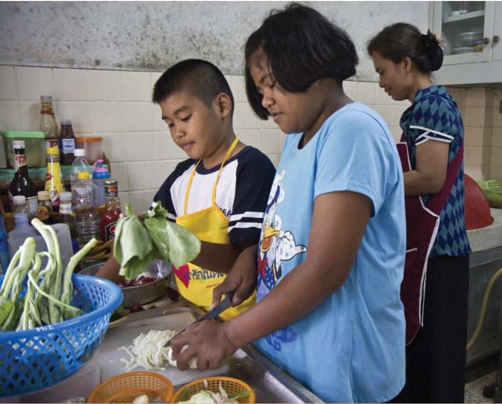
น้องกิ้งกับน้องชายช่วยคุณแม่ทำอาหาร

ข้า ลงมือหันผักอย่างขะมักเขม้น โดยมีน้องชายอีกคนมาเป็นผู้ช่วย