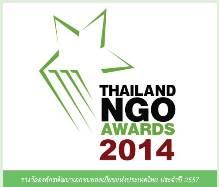
รางวัลองค์กรพัฒนาเอกชนยอดเยี่ยมแห่งประเทศไทย ประจำปี 2557