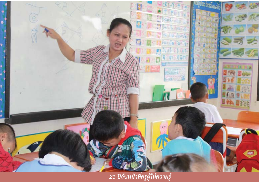
21 ปีกับหน้าที่ครูผู้ให้ความรู้

ครูใหญ่ศูนย์พัฒนาเด็กเล็กหมู่บ้านเด็กโสสะ “เฉลิมนารินทร์” หนองคาย ก็เช่นกัน ผู้ที่อุทิศตนมากกว่าการเป็นครูในการสั่งสอนเด็กๆ ในศูนย์พัฒนาเด็กเล็กให้มีพื้นฐานความรู้ที่ดี ก่อนที่พวกเขาจะก้าวเดินต่อไปในการศึกษาที่สูงขึ้นในวันข้างหน้า