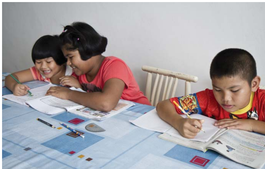
สอนการบ้านให้กับน้องๆ

หมายเหตุ: ชื่อที่ปรากฏในบทความนี้ ได้มีการเปลี่ยนแปลงเพื่อความเหมาะสม อันเป็นไปตามนโยบายด้านสิทธิเด็ก