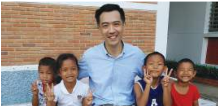
เรียน ท่านผู้มีจิตเมตตา

ตั้งแต่ช่วงต้นปีที่ผ่านมา ทั่วโลกต่างต้องเผชิญกับเหตุการณ์วิกฤต อย่างไม่ทันได้เตรียมตัว โดยเฉพาะการแพร่ระบาดของโรคโควิด-19 (COVID-19) ที่มีความรุนแรงกระจายเป็นวงกว้าง ซึ่งประเทศไทยเอง ก็ได้รับผลกระทบทั้งทางตรงและทางอ้อมเป็นอย่างมาก คนไทยต่างตื่นตัว และปรับตัวอย่างรวดเร็วเพื่อช่วยกันยับยั้งความรุนแรงจากผลกระทบนี้ รวมถึงมูลนิธิเด็กโสสะฯ เองก็เช่นกัน เด็กๆ และบุคลากรภายในหมู่ บ้านเด็กโสสะทั้ง 5 แห่ง ได้ปฏิบัติตามมาตรการป้องกันการแพร่ ระบาดของโรคโควิด-19 อย่างเคร่งครัด เจ้าหน้าที่ได้เพิ่มความเข้มงวด กับจุดคัดกรองของหมู่บ้านฯ เด็กๆ ต้องปรับเปลี่ยนพฤติกรรมต่างๆ ใน ชีวิตประจำวันที่เปลี่ยนไป ทุกคนให้ความร่วมมือกันกักตัวอยู่ในหมู่