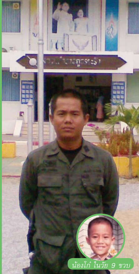
น้องโก้ ในวัย 9 ขวบ

แม้เส้นทางเดินของแต่ละชีวิต อาจไม่ได้โรยด้วยกลีบกุหลาบ ถึงจะล้มลุกคลุกคลานมาเท่าไร แต่เมื่อยังมีลมหายใจอยู่ชีวิตก็ต้องสู้และก้าวเดินต่อไปให้ถึงที่สุด ให้สมกับคุณค่าของ “โอกาส” ในชีวิตที่ได้รับมา