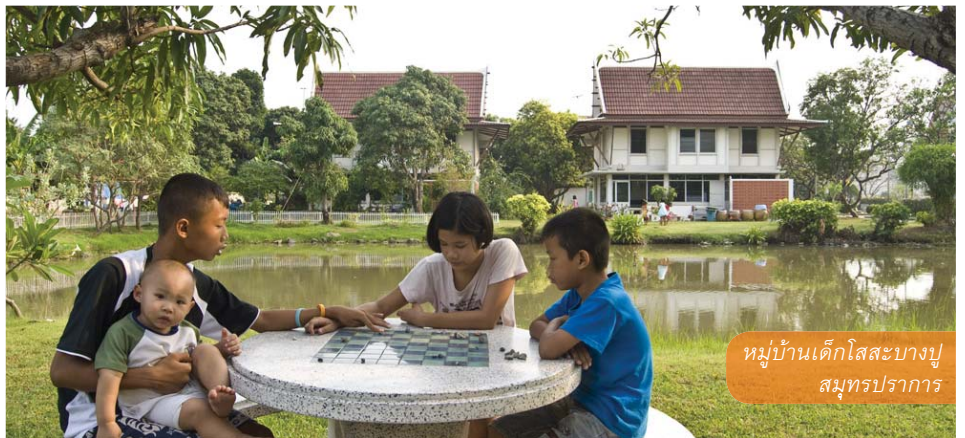
หมู่บ้านเด็กโสสะบางปู สมุทรปราการ

ที่หมู่บ้านเด็กโสสะเด็กที่ครั้งหนึ่งเคยสูญเสียพ่อแม่ ขาดญาติมิตร สามารถเติบโตขึ้นเป็นส่วนหนึ่งของ ครอบครัวอีกครั้ง โดยเด็กได้รับการเลี้ยงดูในครอบครัวที่อบอุ่น เต็มเปี่ยมด้วยความรักจากแม่โสสะ เติบโตขึ้นท่ามกลางสายสัมพันธ์ของพี่น้องในบ้าน และอยู่ร่วมกันในชุมชนหมู่บ้านเด็กที่เอื้อเพื่อเกื้อกูล กัน อีกทั้งเด็กยังได้รับการศึกษาสูงสุดตามความสามารถ จนออกไปประกอบอาชีพและเลี้ยงดูตัวเองได้ รวมทั้งอยู่ร่วมกับสังคมได้อย่างมีความสุข ปัจจุบันมีเด็กอยู่ในการดูแลของครอบครัวโสสะประมาณ 600 คน ในหมู่บ้านเด็กโสสะทั้ง 5 แห่ง ได้แก่บางปู สมุทรปราการ, หาดใหญ่ สงขลา, หนองคาย, เชียงราย และภูเก็ต มีเด็กที่ได้รับการเลี้ยงดูจากครอบครัวโสสะ จนเติบโตเป็นผู้ใหญ่สามารถประกอบอาชีพและ เลี้ยงดูตัวเองได้กว่า 400 คน