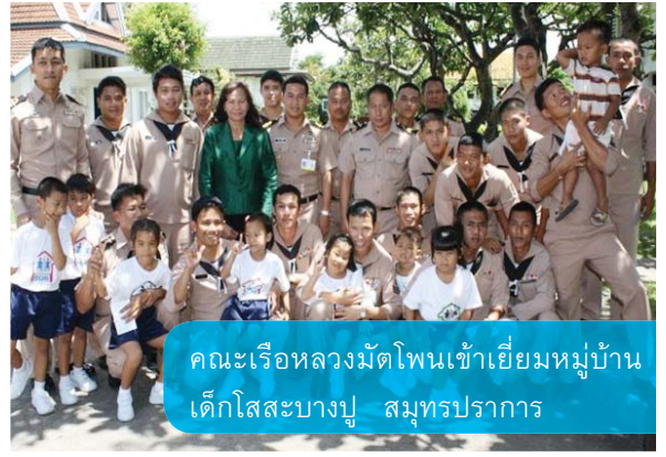
คณะเรือหลวงมัตโปนเข้าเยี่ยมหมู่บ้าน เด็กโสสะบางปู สมุทรปราการ