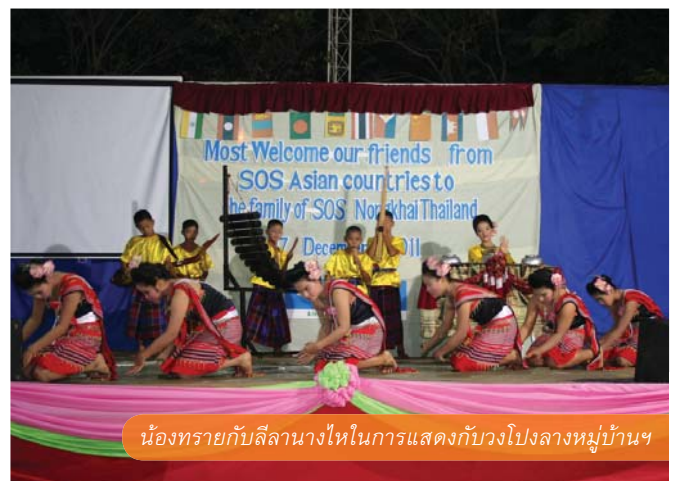
น้องทรายกับลีลางาไหในการแสดงกับวงโปงลางหมู่บ้านฯ

หมายเหตุ ชื่อของเด็กในบทความนี้ได้มีการเปลี่ยนแปลงตามความเหมาะสม