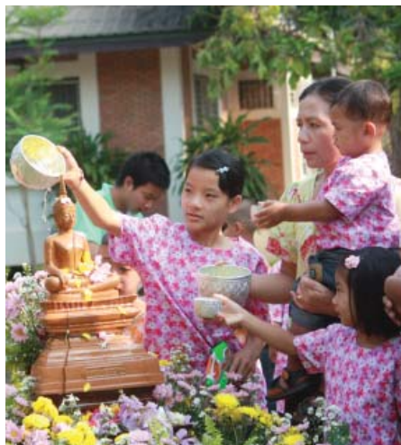
ร่วมงานสงกรานต์แบบไทยๆ กับครอบครัว