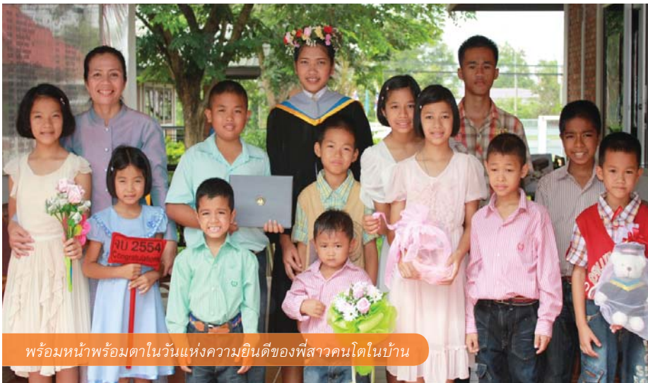
พร้อมหน้าพร้อมตาในวันแห่งความยินดีของพี่สาวคนโตในบ้าน

หมู่บ้านเด็กโสสะหนองคาย เราจะได้เห็นน้องทรายอยู่แถวหน้าของขบวนซึ่ง เพื่อสร้างความสนุกให้กับผู้รับชมหรือเดี่ยวชม ที่ขับกล่อมให้ผู้รับฟังประทับใจในเสียงดนตรีไทยอันอ่อนโยนละเมียดละไม ด้วยความสามารถอันเป็นที่ประจักษ์ ทางคุณแม่และคุณอาผู้อำนวย การหมู่บ้านจึงส่งเสริมให้น้องทรายได้เข้าร่วมกิจกรรมชั้นเรียนพิเศษเพิ่มเติม ทั้งนาฏศิลป์และดนตรีไทยในช่วงวันหยุดสุดสัปดาห์และปิดเทอม โดยจะมีทั้งคุณครูนาฏศิลป์และคุณครูดนตรีไทยมาฝึกสอนให้กับน้องทรายและเด็กๆในหมู่บ้านที่สนใจ “หนูชอบเวลาที่ไปซ้อมรำกับคุณครูมาก ค่ะ เพราะนอกจากจะได้ความรู้แล้ว ยังได้เรียนไปพร้อมกับเพื่อนๆ พี่ๆและน้องๆในหมู่บ้าน ด้วย อย่างรำนี้มันต้องเน้นความพร้อมเพรียงนะค่ะ โดยเฉพาะเชิงแบบอีสานนี่การจับจังหวะ สำคัญมาก เพื่อให้ทุกคนรำออกมาสวยงามเป็นหนึ่งเดียวกันค่ะ” ความคิดเห็นของหนูน้อยที่มีต่อกิจกรรมพิเศษ ซึ่งไม่เพียงให้ความรู้ในยามว่าง หากยังเพิ่มพูนทักษะเฉพาะด้านของเด็กๆ และการเสริมสร้างความสามัคคีให้กับหมู่คณะอีกด้วย ยิ่งไปกว่านั้นชั้นเรียนดนตรีไทยของหมู่บ้านเด็กโสสะหนองคายยังเติบโตเป็นคณะดนตรีไทยของเด็กๆ ที่มีฝีมือเยี่ยมเข้าขั้นถึงขนาดเคยไปแสดงงานบุญ ไม่ว่าจะป็นงานบวชงานแต่ง