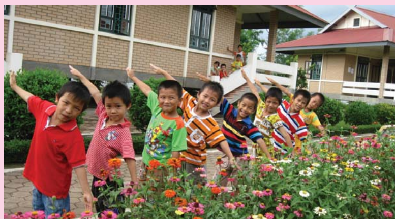
SOS Children's Villages Vietnam หมู่บ้านเด็กเอส โอ เอส เดียนเบียนฟู ประเทศเวียดนาม