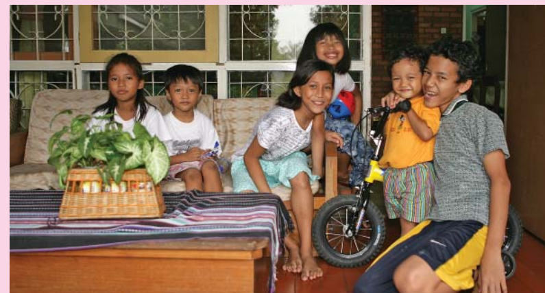
SOS Children's Villages Indonesia หมู่บ้านเด็กเอส โอ เอส จาการ์ตา ประเทศอินโดนีเซีย