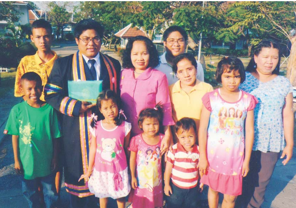
เอและปีในวันแห่งความสำเร็จ พร้อมครอบครัวร่วมแสดงความยินดี (ปี 2551)

ชีวิตคนก็เหมือนเหยี่ยว 2 ด้าน มีทั้งทุกข์และสุข เปลี่ยนแปลงไปมาอยู่เสมอ