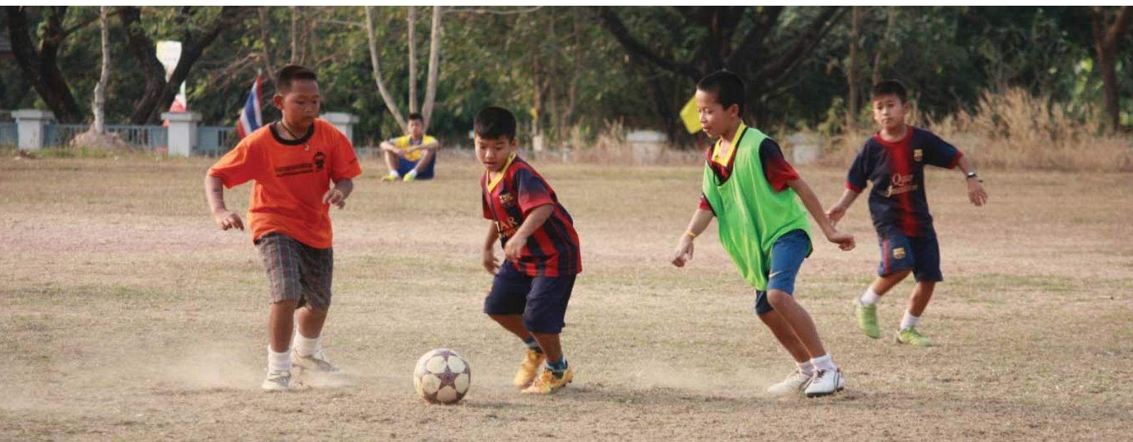
ต้นข้าวในเกมส์การแข่งขันฟุตบอล

หมายเหตุ: ชื่อของเด็ก ในบทความนี้ได้มีการเปลี่ยนแปลงตามความเหมาะสมเพื่อให้เป็นไปตามนโยบายด้านสิทธิเด็ก