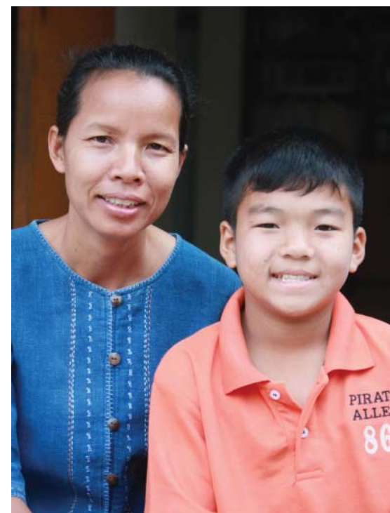
น้องต้นข้าวกับคุณแม่โสสะ

นอกจากการเรียนรู้สิ่งต่างๆแล้ว ความรักที่ต้นข้าวได้ รับจากคุณแม่และพี่น้องภายในบ้านได้แทรกซึมลึกสู่ หัวใจของเขาทุกวัน จนออกดอกผลงดงามกลายเป็น