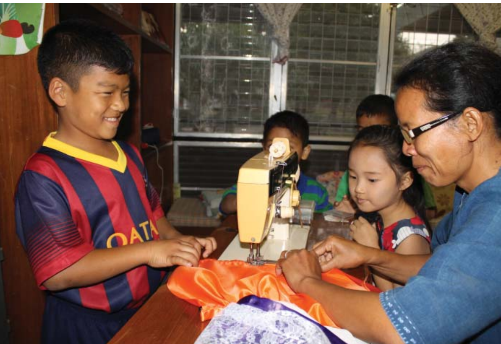
ต้นข้าวและพี่น้องให้กำลังใจคุณแม่ที่กำลังเย็บซ่อมเสื้อผ้าให้

ชีวิตดำเนินไปพร้อมกับทั้งทุกข์และสุข ความเปลี่ยนแปลงเกิดขึ้นได้เสมอ สิ่งสำคัญอยู่ที่การผ่านพ้นความทุกข์ในวันวาน สละความสุขในวันนี้ เพื่อเป็นเสบียงกำลังใจในวันต่อไปได้อย่างไร