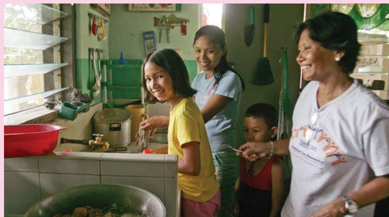
SOS Children's Villages Philippines หมู่บ้านเด็กเอส โอ เอส เซบู ประเทศฟิลิปปินส์