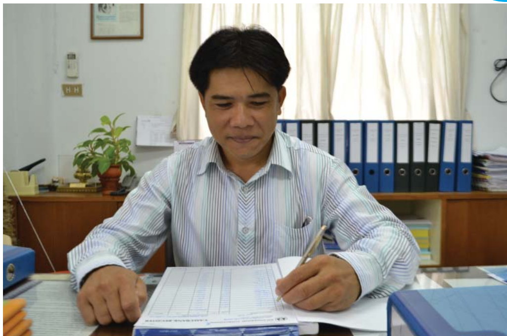
สิบเจ็ดปีกับเส้นทางการทำงานเพื่อลูกโสสะ

“เวลาที่ผมต้องเจอกับปัญหา ขอแค่เราต้องตั้ง สติให้ดี บางปัญหาอาจดูหนักหนานั่นเป็นเพราะใจ เราสร้างขึ้นว่า มันหนัก ทุกปัญหาสามารถแก้ไขได้ แต่ต้องอาศัยระยะเวลา และสิ่งหนึ่งที่จะพาเราก้าว ข้ามปัญหาต่างๆไปได้ ก็คือ “หัวใจ” อีกทั้งกำลังใจ