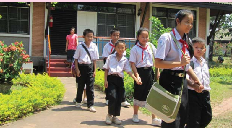
SOS Children's Villages Laos หมู่บ้านเด็กเอส โอ เอส เวียงจันทน์ ประเทศลาว