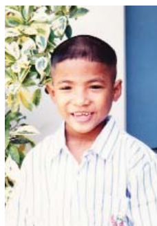
ปีในวัย 7 ขวบ

ผมมาอยู่ที่นี้ตั้งแต่ยังจำความไม่ได้ ผมจึงไม่ได้รู้สึกถึงการพลัดพราก การจากลากับครอบครัวเดิมที่ผมไม่รู้จัก นั่นอาจจะเป็นความโชคร้ายของผมและพี่ชาย แต่พี่น้องเราบางคนเขายังจดจำเรื่องราวเกี่ยว