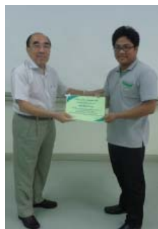
ผ่านการอบรมของบริษัท

กับครอบครัวเดิมและสิ่งที่เกิดขึ้นในชีวิตเขาได้ ซึ่งนั่นอาจเป็นส่วนหนึ่งของประสบการณ์วันวานที่เจ็บปวดของพวกเขา แต่อย่างไรก็ตามเราทุกคนไม่สามารถย้อนกลับไปแก้ไขอดีตที่เกิดขึ้นแล้วได้ ทว่าลองมองให้ดี ชีวิตก็เหมือนเหยี่ยวที่มี 2 ด้าน ถัดจากความพลัดพรากแล้ว ความโชคร้ายที่เกิดขึ้นกลับเปิดโอกาสให้เราได้เปลี่ยนแปลงชีวิต จนได้เข้ามาอยู่ในครอบครัวโสสะที่อบอุ่น มีคุณแม่โสสะคอยเลี้ยงดู ให้ความรัก มีพี่น้องที่คอยห่วงหาอาทร มีเพื่อนบ้านที่ช่วยเหลือเกื้อกูลกัน อีกทั้งยังได้รับการศึกษาเหมือนเด็กที่มีครอบครัวทั่วไป ผมดีใจมากครับที่ได้เกิดเป็นลูกโสสะ ที่นี้หล่อหลอมให้ผมเป็นคนเต็มคน