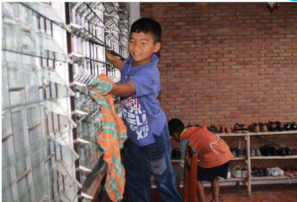
กิจวัตรประจำวันที่ต้นข้าวได้รับมอบหมาย

ความรักความผูกพันต่างสายเลือดที่ตัดไม่ขาด และ ด้วยบุคลิกของต้นข้าวที่เป็นเด็กโอบอ้อมอารี จึงไม่ยากนักที่ความรักของเขาจะถูกส่งต่อไปยังน้องชายตัวน้อยอย่างแสนบริสุทธิ์