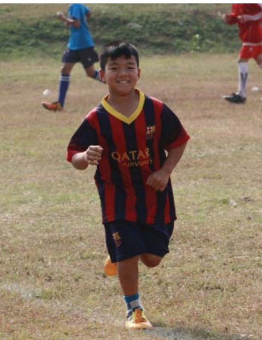
ฟุตบอลกีฬาที่ต้นข้าวชื่นชอบ