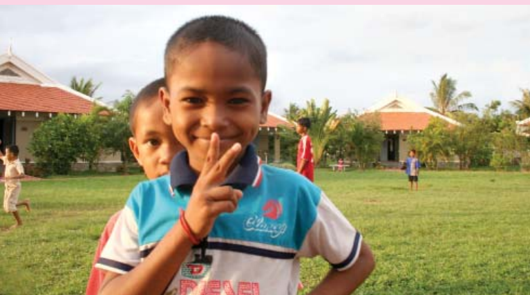
SOS Children's Villages Cambodia หมู่บ้านเด็กเอส โอ เอส พนมเปญ ประเทศกัมพูชา

สำหรับองค์กรเอส โอ เอส สากล ก็ได้มีการดำเนินการอยู่ในอาเซียนด้วยเช่นเดียวกัน ทั้งนี้ก็เพื่อช่วยเหลือเด็กที่สูญเสียบิดามารดาในภูมิภาคเอเชียตะวันออกเฉียงใต้ ให้ได้เติบโตขึ้นมาให้ครอบครัวเอส โอ เอส ที่เต็มเปี่ยมด้วยความรัก ความอบอุ่นอีกครั้ง ปัจจุบันมีการดำเนินการอยู่ใน 6 ประเทศในภูมิภาคอาเซียน ได้แก่ ลาว เวียดนาม กัมพูชา ฟิลิปปินส์ อินโดนีเซีย และไทย นอกจากนี้พวกเราจะเป็นครอบครัวเอส โอ เอสในภูมิภาคอาเซียนที่มีแนวคิดและรูปแบบในการทำงานเหมือนกันแล้ว ยังมีความร่วมมือระหว่างกัน ไม่ว่าจะเป็นการแลกเปลี่ยนประสบการณ์ ข้อมูลข่าวสาร การจัดประชุมระดับภูมิภาค การสนับสนุนเจ้าหน้าที่ในการช่วยเหลือกรณีภัยพิบัติ ฯลฯ เพราะทั้งนี้เราทุกคน มีจุดมุ่งหมายเดียวกัน ในการมอบอนาคตให้เด็กทั่วอาเซียนที่สูญเสียครอบครัว ให้ได้มีโอกาสที่สองในชีวิตและมีครอบครัวที่อบอุ่นอีกครั้ง เพื่อเป็นส่วนหนึ่งในการขับเคลื่อนภูมิภาคนี้ให้เป็นสมาคมประชาชาติที่เข้มแข็งต่อไปในอนาคต 🏠