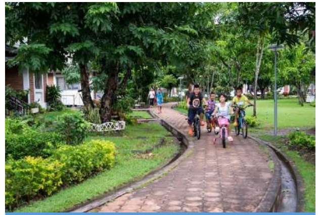
หมู่บ้านเด็กโสสะมีสิ่งแวดล้อมที่ เหมาะสม กับการเจริญเติบโตของเด็ก