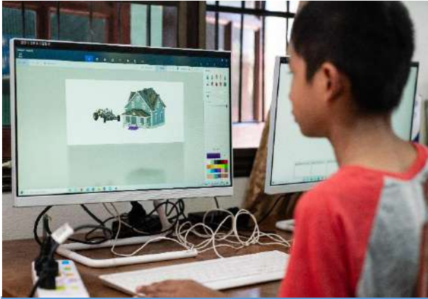
ได้รับการเลี้ยงดูตามพัฒนาการ ที่เหมาะสมตามแต่ละช่วงวัย