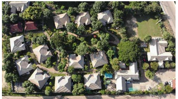
หมู่บ้านเด็กโสสะหนองคาย

การช่วยเหลือเด็กที่สูญเสียบิดามารดา ขาดญาติมิตร ในรูปแบบของ “ครอบครัวทดแทนถาวรระยะยาว” เด็กๆ ได้รับการเลี้ยงดูจากแม่โสสะด้วยความรักความอบอุ่น ในครอบครัวโสสะ และเติบโตท่ามกลางสายสัมพันธ์ พี่น้องชายหญิง ในบ้านแห่งความรักของเด็กทุกคน ซึ่งอยู่ร่วมกันในชุมชนหมู่บ้านที่เอื้อเพื่อเกื้อกูลกัน