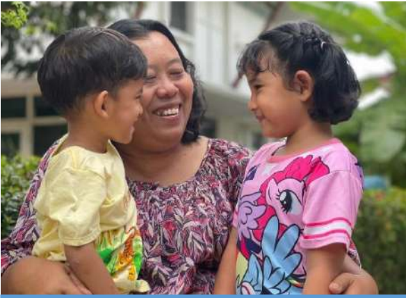
ได้รับการเลี้ยงดูด้วยความรักความอบอุ่น ความมั่นคงปลอดภัย