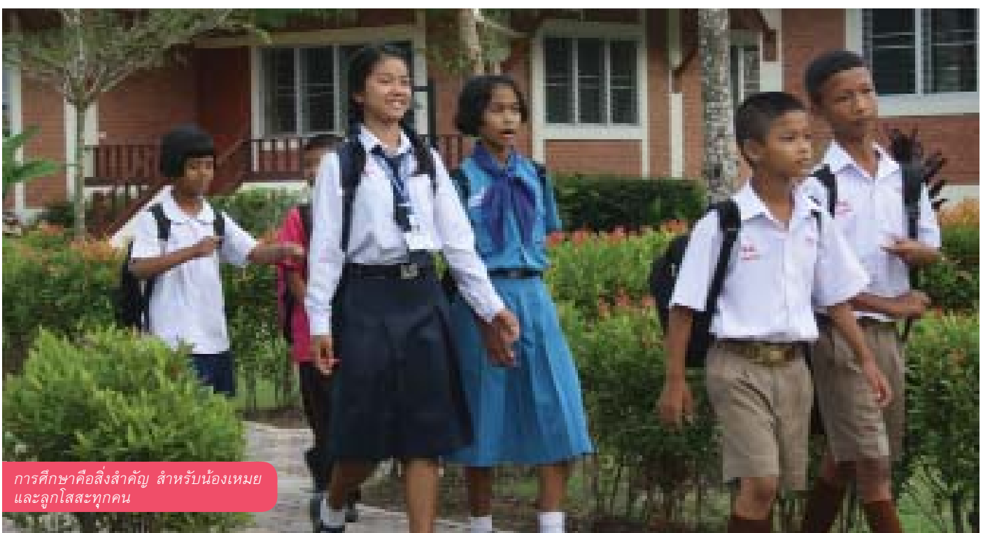
การศึกษาเป็นสิ่งสำคัญ สำหรับน้องเหมยและลูกโสสะทุกคน

หมู่บ้านเด็กโสสะภูเก็ต เจริญพระเกียรติ ๘๐ พรรษา ๕ ธันวาคม ๒๕๕๐ เริ่มดำเนินการเมื่อเมื่อปี พ.ศ. 2550 เป็นหมู่บ้านลำดับที่ 5 ของมูลนิธิเด็กโสสะแห่งประเทศไทยฯ เพื่อให้การช่วยเหลือเด็กไทยที่สูญเสียบิดามารดา ขาดญาติมิตรในจังหวัดภูเก็ตและจังหวัดใกล้เคียงในภาคใต้ ปัจจุบันมีเด็กในการดูแลจำนวน 119 คน ในหมู่บ้านมีครอบครัวโสสะจำนวน 12 หลัง มีศูนย์พัฒนาเด็กเล็กในระดับอนุบาล 1-3 ให้การศึกษา สำหรับเด็กวัยอนุบาลทั้งเด็กจากครอบครัวโสสะและจากชุมชนโดยรอบหมู่บ้าน