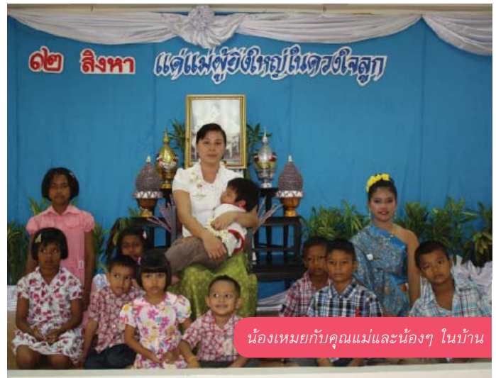
น้องเหมยกับคุณแม่และน้องๆ ในบ้าน

ปณิธานไว้เลยว่าหนูจะตั้งใจเรียน หนูจะเป็นคนดี”