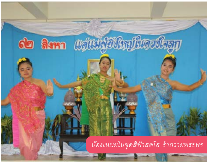
น้องเหมยในชุดสีฟ้าสดใส รำถวายพระพร