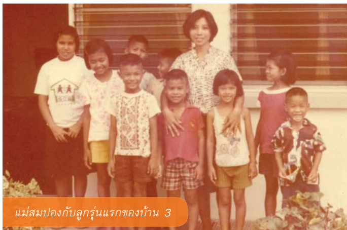
แม่สมปองกับลูกรุ่นแรกของบ้าน 3

แม่โสสะเกษียณ คือ คุณแม่โสสะผู้อุทิศตนในการดูแลเด็กที่ขาดบิดามารดา ไร้ญาติมิตร ให้ได้รับความรัก ความอบอุ่น เปรียบเสมือนแสงส่องสว่างนำทางชีวิตของลูกโสสะตลอดระยะเวลาการทำงาน เมื่อคุณแม่โสสะมีอายุ 60 ปี จะเป็นคุณแม่เกษียณ ทางมูลนิธิฯ จะดูแลคุณแม่เกษียณโดยมีบ้านพักให้ภายในหมู่บ้าน เพื่อที่ลูกๆ ที่ออกไปแล้วจะยังสามารถกลับมาเยี่ยมเยียนคุณแม่ได้ตลอดเวลา และคุณแม่เกษียณเองก็จะเป็นคุณยายให้กับลูกโสสะรุ่นต่อไป