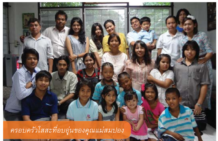
ครอบครัวโสสะที่อบอุ่นของคุณแม่สมปอง