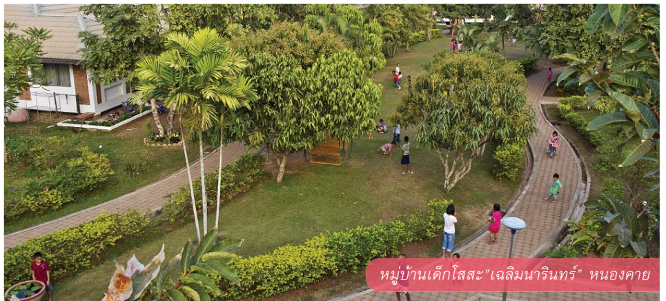
หมู่บ้านเด็กโสสะ "เฉลิมนารินทร์" หนองคาย

ที่หมู่บ้านเด็กโสสะเด็กที่ครั้งหนึ่งเคยสูญเสียพ่อแม่ ขาดญาติมิตร สามารถเติบโตขึ้นเป็นส่วนหนึ่งของครอบครัวอีกครั้ง โดยเด็กได้รับการเลี้ยงดูในครอบครัวที่อบอุ่น เต็มเปี่ยมด้วยความรักจากแม่โสสะเติบโตขึ้นท่ามกลางสายสัมพันธ์ของพี่น้องในบ้าน และอยู่ร่วมกันในชุมชนหมู่บ้านเด็กที่เอื้อเฟื้อเกื้อกูลกัน อีกทั้งเด็กยังได้รับการศึกษาสูงสุดตามความสามารถ จนออกไปประกอบอาชีพและเลี้ยงดูตัวเองได้ รวมทั้งอยู่ร่วมกับสังคมได้อย่างมีความสุข ปัจจุบันมีเด็กอยู่ในการดูแลของครอบครัวโสสะประมาณ 650 คน ในหมู่บ้านเด็กโสสะทั้ง 5 แห่ง ได้แก่ บางปู สมุทรปราการ, หาดใหญ่ สงขลา, หนองคาย, เชียงราย และภูเก็ต มีเด็กที่ได้รับการเลี้ยงดูจากครอบครัวโสสะ จนเติบโตเป็นผู้ใหญ่สามารถประกอบอาชีพและเลี้ยงดูตัวเองได้รวม 500 คน