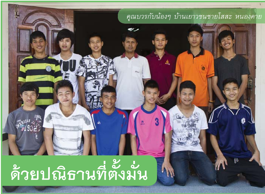
คุณบรรกับน้องๆ บ้านเยาชนชายโสสะ หนองคาย