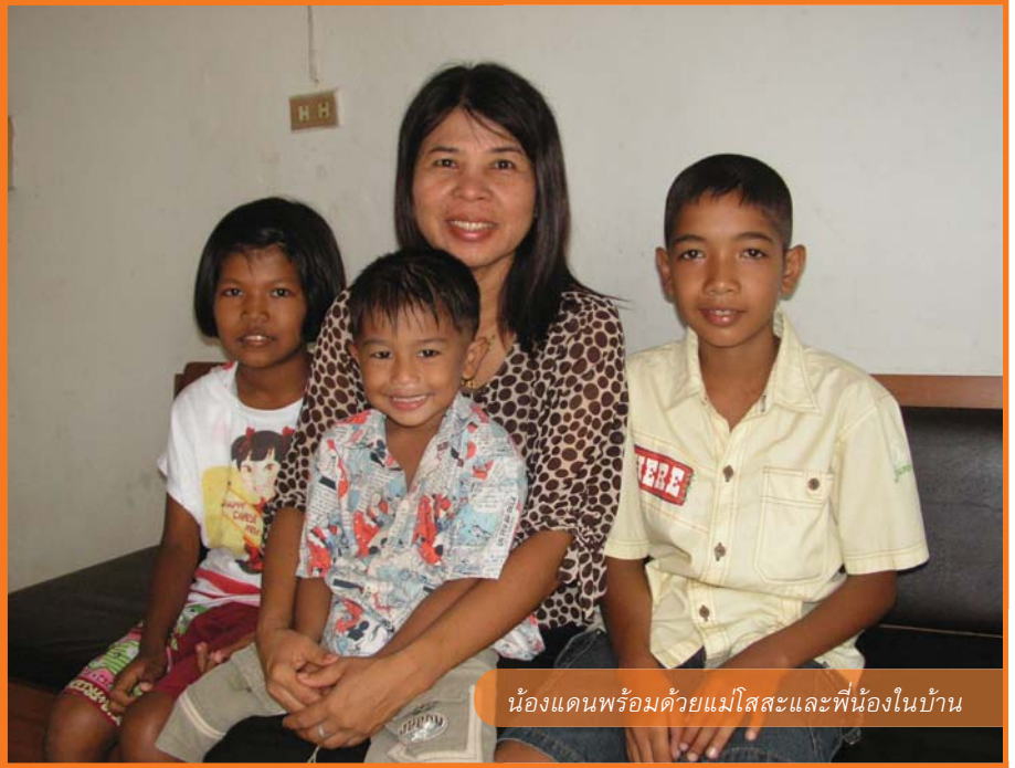
น้องแดนพร้อมด้วยแม่โสสะและพี่น้องในบ้าน

จะมีใครสักคนรู้อย่างไรไหมว่า การที่เกิดมาบนโลกใบนี้ แล้วไม่ได้เป็นส่วนหนึ่งของใครเลย ความรู้สึกของพวกเขาเหล่านั้นจะเป็นอย่างไร