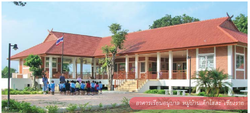
อาคารเรียนอนุบาล หมู่บ้านเด็กโสสะ เชียงราย

ที่หมู่บ้านเด็กโสสะเด็กที่ครั้งหนึ่งเคยสูญเสียพ่อแม่ ชาตญาติมิตร สามารถเติบโตขึ้นเป็นส่วนหนึ่งของครอบครัวอีกครั้ง โดยเด็กได้รับการเลี้ยงดูในครอบครัวที่อบอุ่น เต็มเปี่ยมด้วยความรักจากแม่โสสะเติบโตขึ้นท่ามกลางสายสัมพันธ์ของพี่น้องในบ้าน และอยู่ร่วมกันในชุมชนหมู่บ้านเด็กที่เอื้อเพื่อเกื้อกูลกัน อีกทั้งเด็กยังได้รับการศึกษาสูงสุดตามความสามารถ จนออกไปประกอบอาชีพและเลี้ยงดูตัวเองได้ รวมทั้งอยู่ร่วมกับสังคมได้อย่างมีความสุข ปัจจุบันมีเด็กอยู่ในการดูแลของครอบครัวโสสะประมาณ 650 คน ในหมู่บ้านเด็กโสสะทั้ง 5 แห่ง ได้แก่บางปู สมุทรปราการ, หาดใหญ่ สงขลา, หนองคาย, เชียงราย และภูเก็ต มีเด็กที่ได้รับการเลี้ยงดูจากครอบครัวโสสะ จนเติบโตเป็นผู้ใหญ่สามารถประกอบอาชีพและเลี้ยงดูตัวเองได้รวม 500 คน